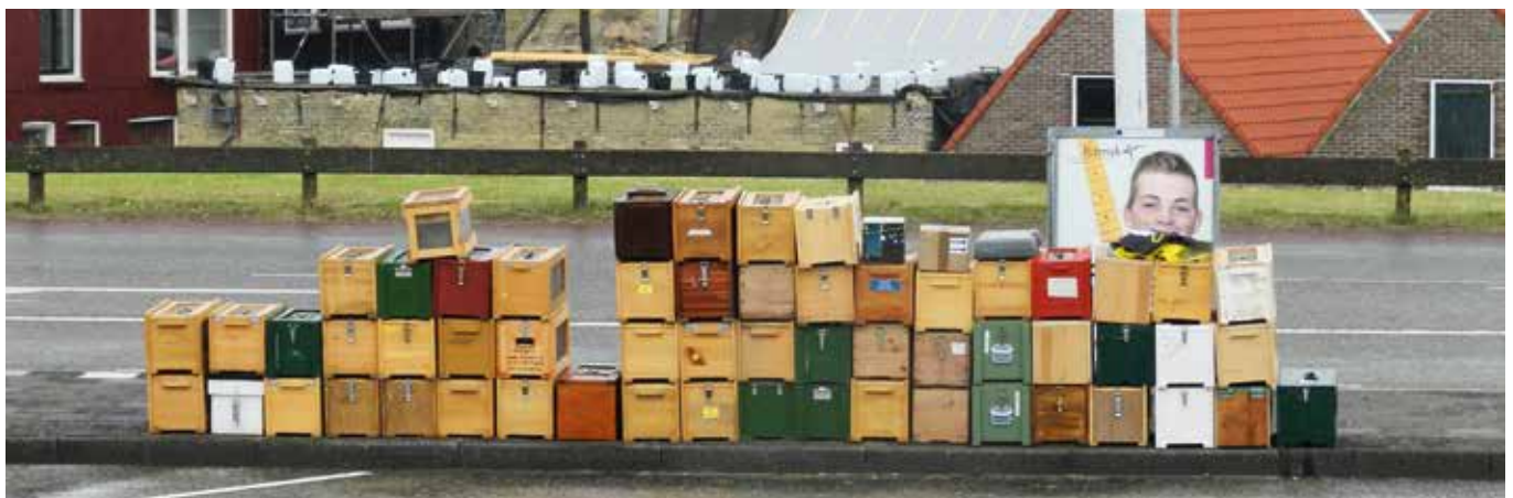
Transportkisten op de kade van de haven in Harlingen (2016) wachtend op de boot naar Vlieland.

De leden van de werkgroep selecteren vooral op totaalteeltwaarde met speciale aandacht voor zachtaardigheid en varroaweerstand. Drie leden selecteren bovendien op VSH, varroa-gevoelige hygiëne. In Figuur 1 is te zien dat de selectie gewerkt heeft. In 2009 komt de Nederlandse werkgroep het laagst uit, in 2016 het hoogst. Vergeleken is hier met Landesverband Weser-Ems (WE) en met het totaal van de databank. Weser-Ems is gekozen omdat de Werkgroep daarop sterk leunt door gebruik te maken van hun materiaal en van hun bevruchtungs-eilanden. Bovendien is het een van de meest succesvolle teeltgroepen. Het verschil tussen WE en het totaal van de databank is tamelijk stabiel. Weser-Ems loopt iets uit, maar NL begint het laagst en eindigt het hoogst. Dit komt doordat de leden van de Werkgroep scherper selecteren dan WE, zowel aan de koninginnenkant als wat betreft de keuze van de aanparingen. Die aanparingen gebeuren grotendeels op Vlieland, Norderney en Wanger-